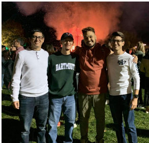
HOGUERA DE REGRESO A CASA (PRIMERO A LA DERECHA)