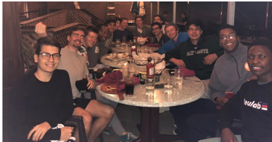
DISFRUTANDO DE UNA CENA DE DESPEDIDA CON SU EQUIPO DE FÚTBOL PARA GRADUADOS DE ÚLTIMO AÑO. (FRENTE A LA IZQUIERDA)