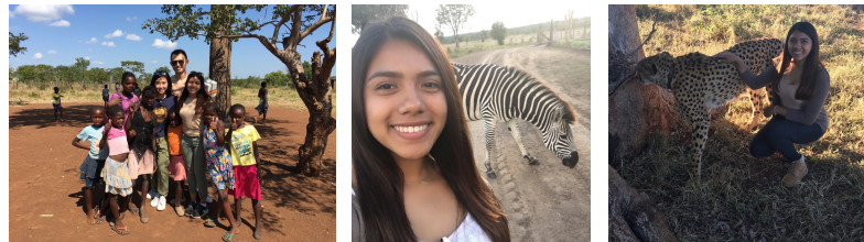
AYUDANDO CON EL DESARROLLO SOSTENIBLE EN UNA ESCUELA PRIMARIA Y TRABAJANDO EN LA CONSERVACIÓN DE LA VIDA SILVESTRE EN ZIMBABWE

Zimbabwe fue su experiencia voluntaria favorita. "¡Más vida salvaje!" Iba de safari todos los días y realizaba limpiezas de carreteras porque muchas carreteras de la zona donde vivía estaban hechas de tierra. También fue voluntaria en una escuela primaria que amaba. Zimbabwe ofreció una combinación de todos los elementos que disfruta: niños, activismo, vida silvestre y educación y conservación ambiental.