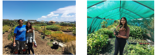
TRABAJANDO CON PUEBLOS INDÍGENAS DE NUEVA ZELANDA PARA RESTAURAR EL MEDIO AMBIENTE CON PLANTAS NATIVAS

En Australia, trabajó para una organización de rehabilitación y conservación de la vida silvestre que rescataba animales nativos. "Teníamos que levantarnos a las 7 de la mañana y trabajar hasta la medianoche. Fue un trabajo arduo. Teníamos que alimentar a los canguros bebés cada 3 horas y había más de 40 de ellos. ¡Y justo cuando todos terminamos, llegó el momento de la siguiente alimentación de canguro bebé!" También hubo mucho trabajo manual involucrado, como cortar leña y limpiar los desechos de los animales.