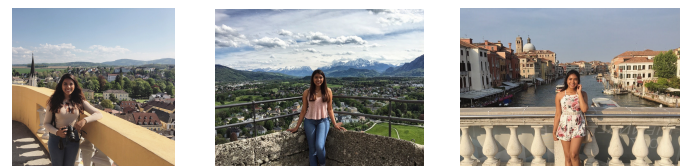
DISFRUTANDO DE AUSTRIA E ITALIA

Esas experiencias la llevaron de regreso al campo de las ciencias ambientales y, en última instancia, la ayudaron a elegir su especialidad. "Solo quiero crear un impacto positivo para el futuro y nuestras generaciones futuras porque sé que no se está cuidando nuestro medio ambiente. Tenemos tanta contaminación. Hay contaminación plástica en los océanos, hay cambio climático. Me gustaría ayudar no solo a nuestro país, sino también a otros países porque todos compartimos este mundo".